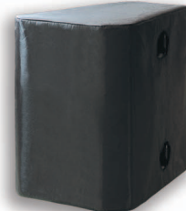
Protective Nylon cover. Fundas protectoras de Nylon.